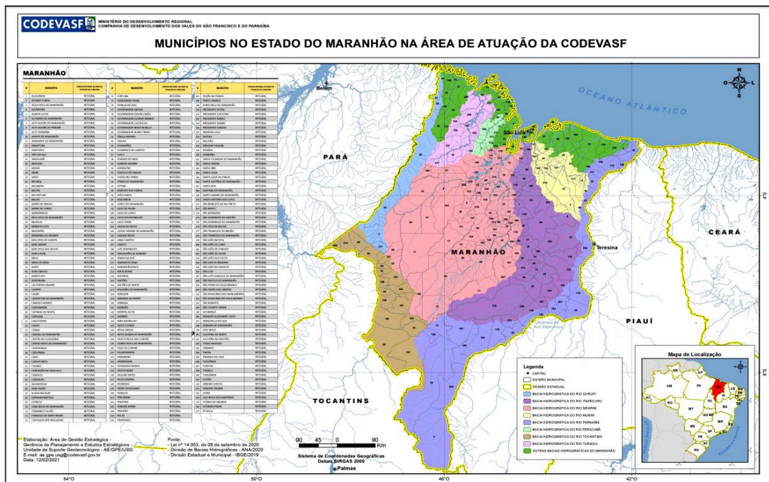
Figura 7: Municípios no estado do Maranhão na área de atuação da Codevasf (municípios da área de atuação da 8ª Superintendência Regional).

4.1.7 Grupos 13 e 14: as mudas de plantas frutíferas referentes aos itens que compõem os grupos 13 e 14, deverão ser fornecidas (fornecimento, carga, transporte e descarga) em locais indicados pela Codevasf, em regiões pertencentes à área de atuação da 8ª Superintendência Regional, no estado do Maranhão.