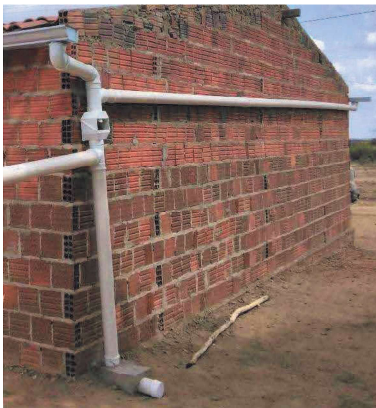
Figura 6: Detalhamento da tubulação de captação e interligação das calhas, filtro separador de folhas, tubulação para desvio das primeiras águas e bloco de ancoragem.