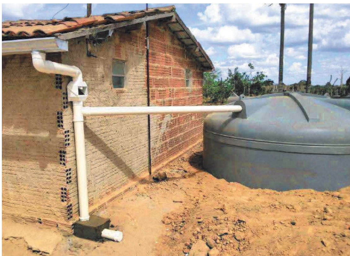
Figura 8: Visão geral da cisterna instalada.