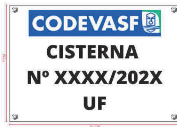
Figura 4: Modelo Padrão da placa de identificação da cisterna.

A placa deverá seguir o modelo indicado na Figura 4.