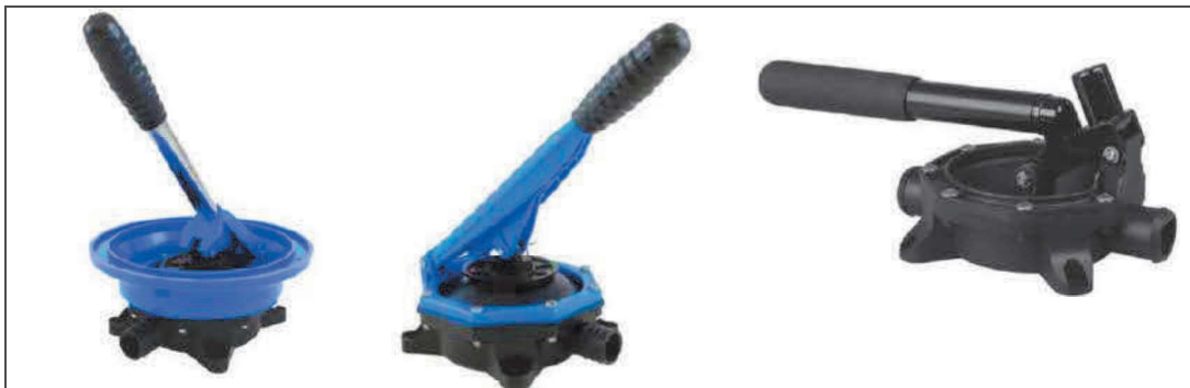
Figura 1: Exemplos de bomba de membrana.

Para exemplificar, abaixo são apresentadas fotos de algumas bombas existentes no mercado.