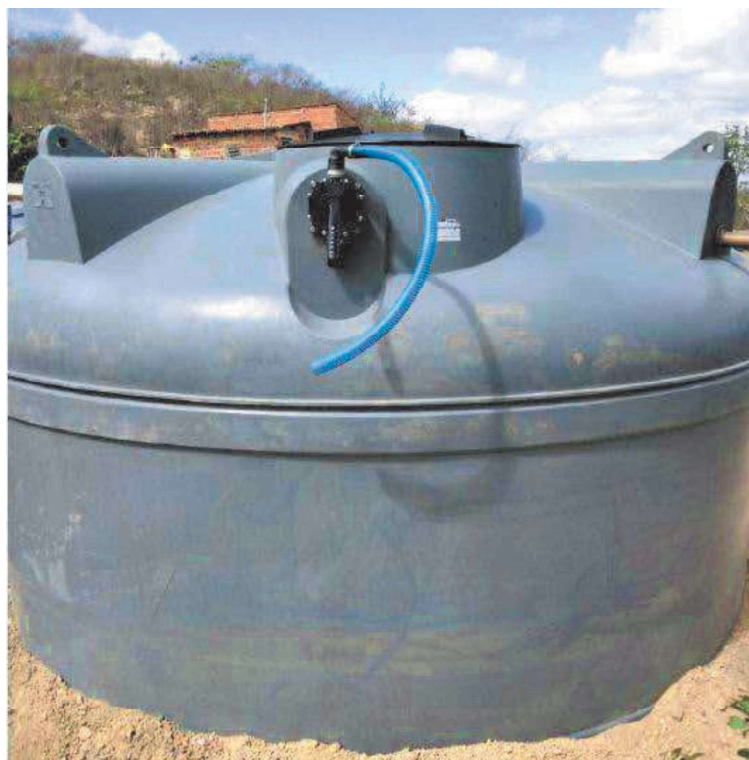
Figura 5: Exemplo de Cisterna de 16.000L instalada.

A seguir são apresentadas algumas imagens da cisterna instalada.