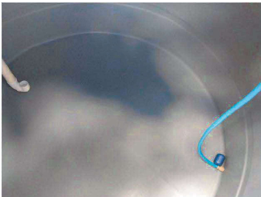
Figura 7: interior da cisterna após a instalação.