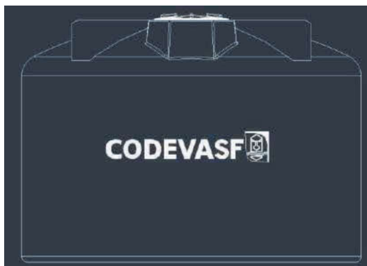
Figura 2: Croqui da cisterna com pintura indelével e/ou serigrafada.

O corpo da cisterna deverá conter a logomarca da Codevasf em dimensões mínimas de 28 cm de altura e largura compatível com a escala da altura, feita por pintura indelével na cor branca ou serigrafada, também na cor branca. A figura 2 ilustra um croqui da cisterna identificada. Salientar para as demais especificações contidas no anexo 8 e no item 21.28 do Termo de Referência.