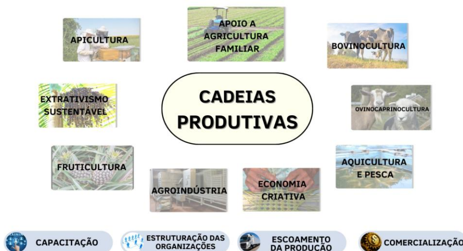
Figura 1 - Algumas das atividades produtivas apoiadas pela Codevasf

As ações da Codevasf que apoiam os APLs visam estruturar a produção nas cadeias produtivas notadamente na agricultura familiar, de modo a promover a melhoria das condições de produção, e conseqüentemente melhorar as condições de vida da população com geração de emprego e renda, uso racional e sustentável dos recursos naturais, dentre outros (Figura 1).