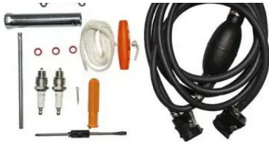
CABO AMARELO COM CORDA BRANCA (CABO DE PARTIDA DE EMERGENCIA)