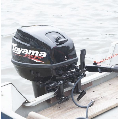
SISTEMA DE PARTIDA MANUAL

Os itens na foto constam no fornecimento dos Motores de popa da TOYAMA. (JOGO DE FERRAMENTA , DUAS VELAS , CABO DE PARTIDA DE EMERGENCIA E MANGUEIRA DE COMBUSTIVEL).