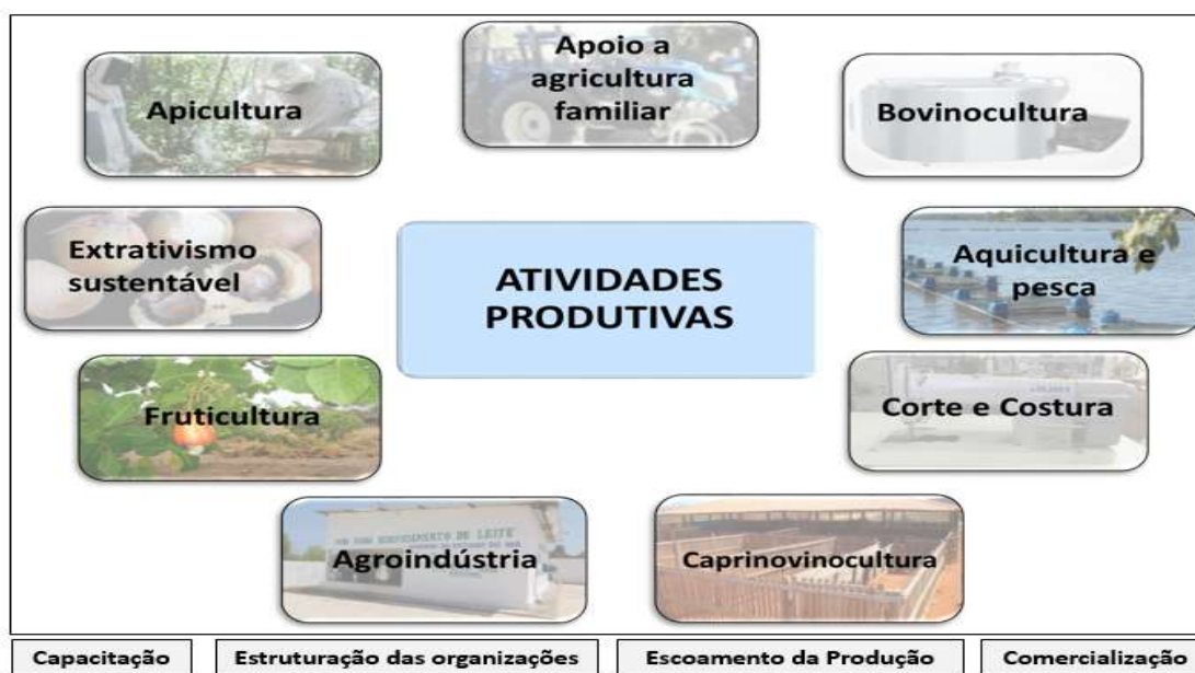
Figura 01: Algumas das atividades produtivas apoiadas pela CODEVASF

O apoio aos Arranjos Produtivos Locais, ocorre de forma continuada ao longo da área da atuação da CODEVASF, por se tratar de ações dinâmicas, tendo em vista que as atividades que visam a produção, sobretudo a de alimentos, estão em constante adequação às demandas de mercado e de necessidade da população regional, nacional e mundial. Neste sentido, a aquisição de equipamentos e materiais para promover a cadeia produtiva da bovinocultura regional.