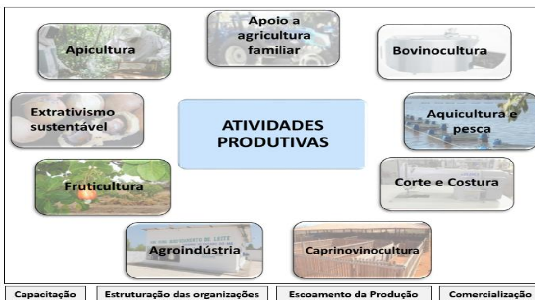
Figura 01: Algumas das atividades produtivas apoiadas pela CODEVASF

O apoio aos Arranjos Produtivos Locais, ocorre de forma continuada ao longo da área da atuação da CODEVASF, por se tratar de ações dinâmicas, tendo em vista que as atividades que visam a produção, sobretudo a de alimentos, estão em constante adequação às demandas de mercado e de necessidade da população regional, nacional e mundial. Neste sentido, a aquisição desses implementos torna-se essencial para o desenvolvimento da agricultura familiar.