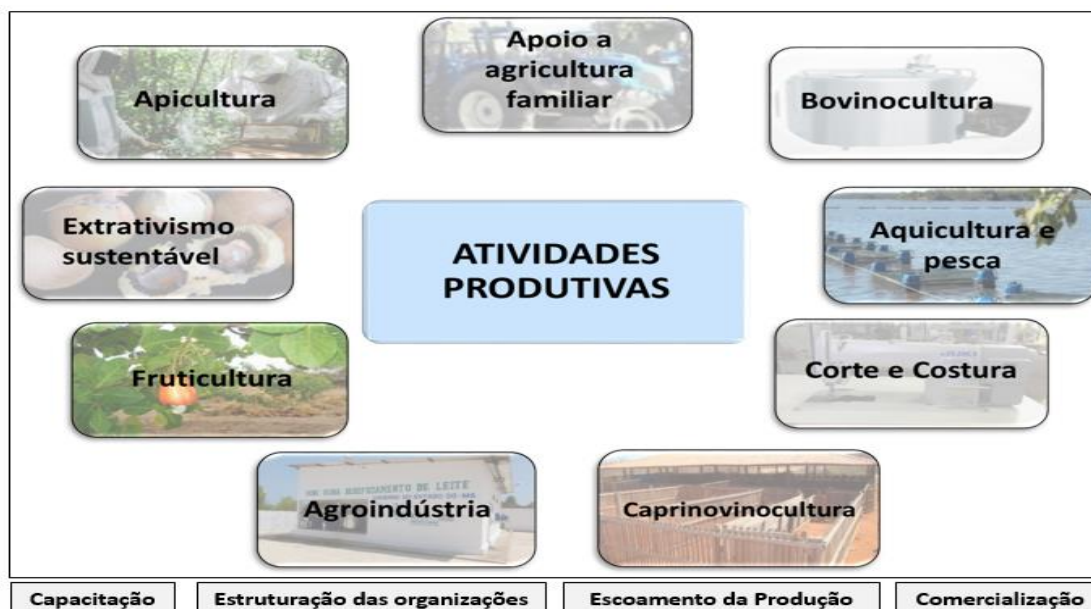
Figura 01: Algumas das atividades produtivas apoiadas pela CODEVASF

O apoio aos Arranjos Produtivos Locais, ocorre de forma continuada ao longo da área da atuação da CODEVASF, por se tratar de ações dinâmicas, tendo em vista que as atividades que visam a produção, sobretudo a de alimentos, estão em constante adequação às demandas de mercado e de necessidade da população regional, nacional e mundial.