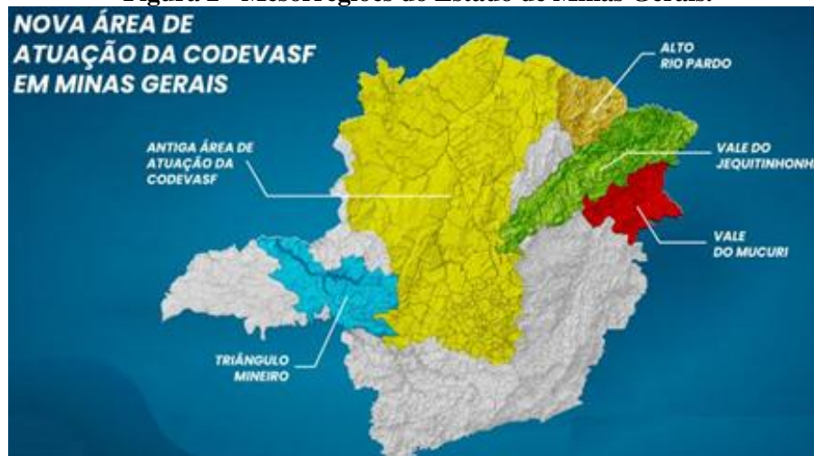
Figura 2 - Mesorregiões do Estado de Minas Gerais.

Em setembro de 2019, no Plenário da Câmara, ocorreu a celebração dos 13 anos da Lei da Agricultura Familiar (Lei nº 11.326, de 24 de julho de 2006). Em seu artigo 3º, é apresentada a definição legal que considera como agricultor familiar e/ou empreendedor familiar rural aquele que pratica atividades no meio rural, atendendo, simultaneamente, aos requisitos: