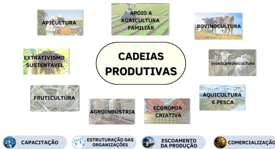
Figura 1 - Algumas das atividades produtivas apoiadas pela Codevasf

Vale destacar que, por se tratar de ações dinâmicas, o apoio aos APLs ocorre de forma continuada ao longo da área da atuação da Codevasf tendo em vista que as atividades produtivas estão em constante modernização e adequação às necessidades da população local, nacional e mundial.