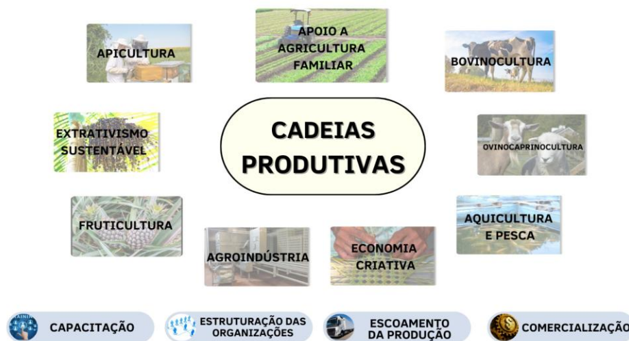
Figura 1 - Algumas das atividades produtivas apoiadas pela Codevasf

Vale destacar que, por se tratar de ações dinâmicas, o apoio aos APLs ocorre de forma continuada ao longo da área da atuação da Codevasf tendo em vista que as atividades produtivas, como a produção de alimentos, estão em constante modernização e adequação às necessidades da população local, nacional e mundial.