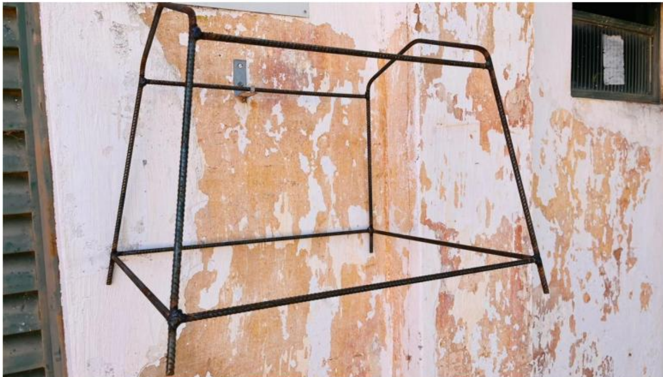
Foto 1 – Item 3 e 12 – Suporte Metálico (cavelete) para colmeia padrão Langstroth