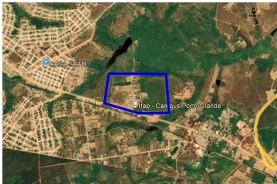
Figura 1: Identificação do local de implantação da Biofábrica, em Porto Grande-AP (Ifap, Campus Porto Grande).